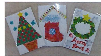
素敵なクリスマスカードいただきました!